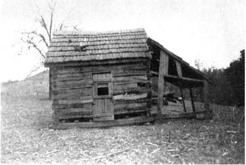
Afb. 1 - De blokhut nabij Burkesville, Kentucky USA, waar William Branham op 6 april 1909 werd geboren.