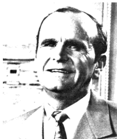
Rev. W.M. Branham