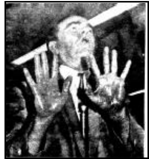
A.A. Allen Foto uit zijn tijdschrift 'Miracle Magazine' (aug. 1967), tonend hoe 'miracle oil' ('wonder-olie') uit zijn handen vloeit.