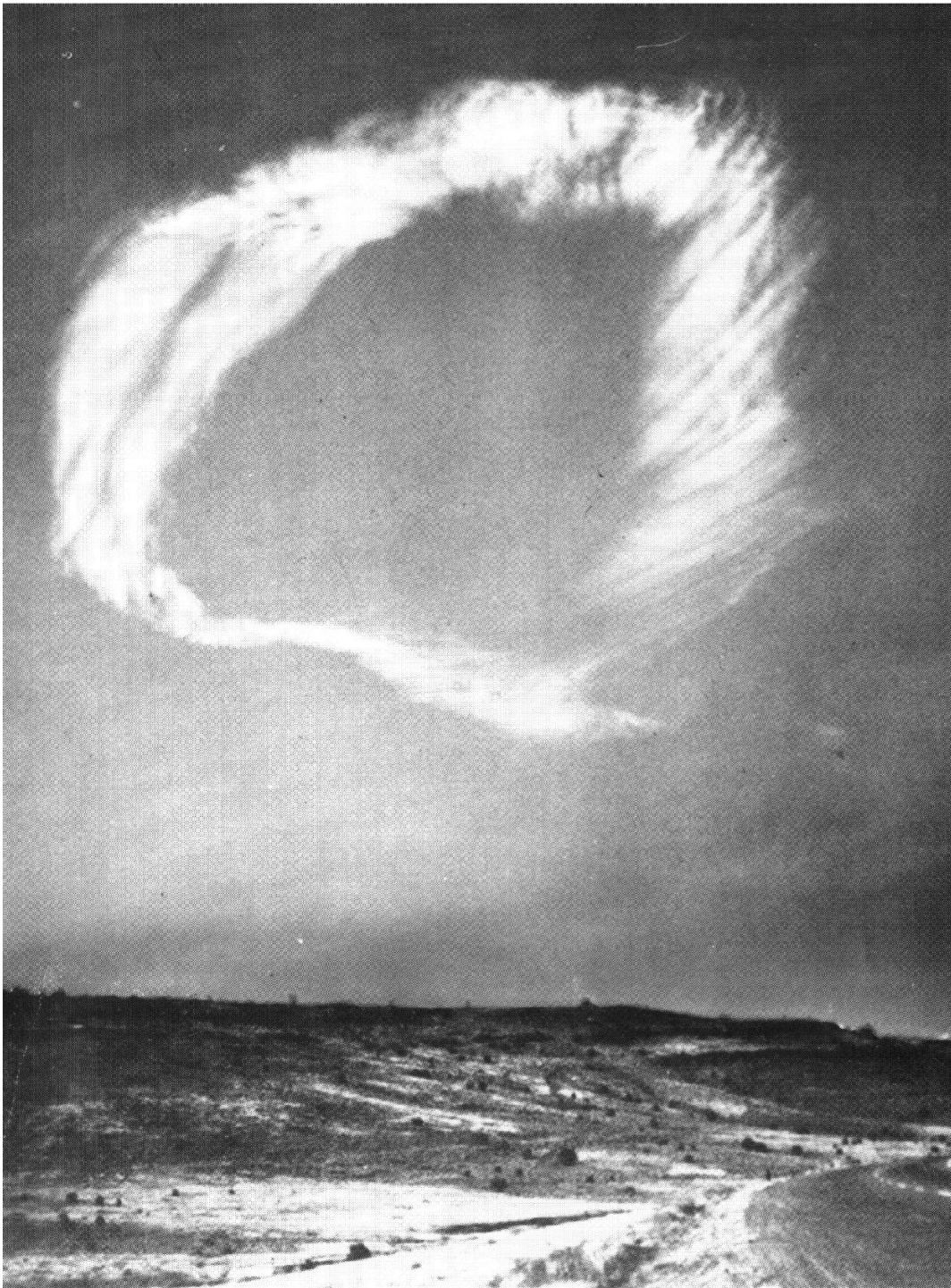
Foto 2 28-2-1963: Onverklaarbare wolk op 35 km hoogte. Voorzgd op 22-12-1962 UIT: Life Magazine 17-05-1963